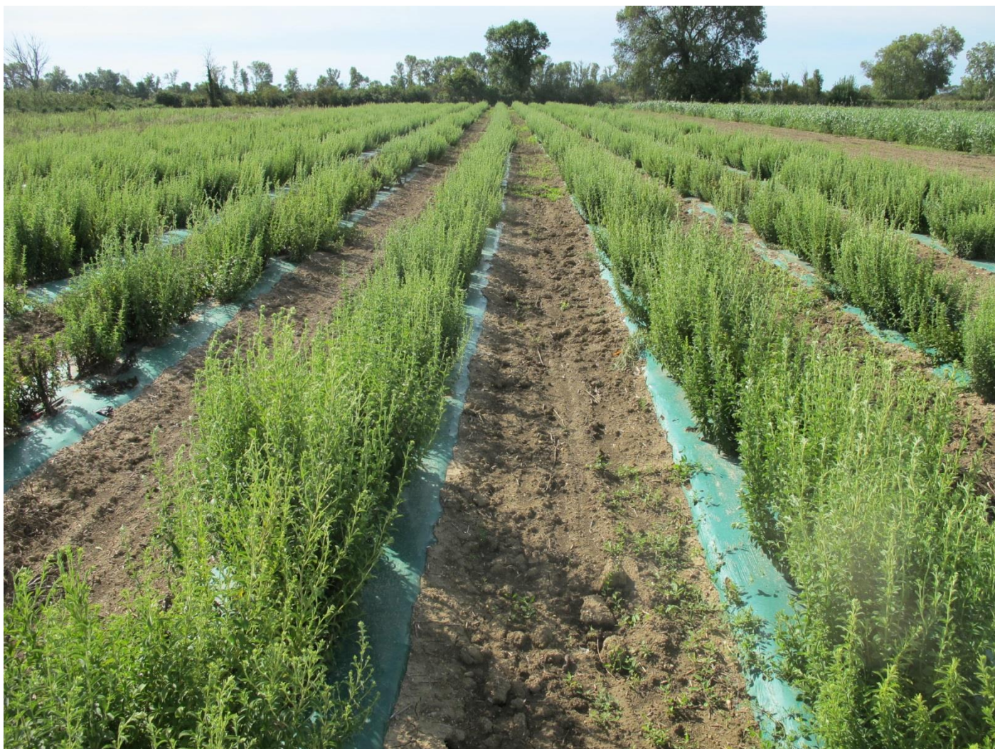
Figure 1: Parcelle de stevia au CEHM en septembre 2014